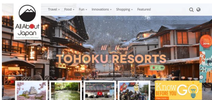
東北ツウアンバサダーが独自の視点で東北の魅力を発信。

「東北エリアには、歴史的建造物や、美しい自然、郷土料理、温泉など日本の魅力が凝縮されており、各県も周遊しやすいことから、特に訪日リピーターが多いアジア圏では次なる観光地として候補に挙げられやすいと考えられます。一方、英語圏においては、東北は歴史的なトピックも乏しく情報も圧倒的に少ないため、認知が低い現状です。そもそも、日本に雪のイメージがあまりないため、ウィンタースポーツができることや、雪質の良さ、景色の美しさなどを発信していくことで、東京との違いをアピールし、東北の魅力を訴求していくことが課題といえそうです」と、語ります。