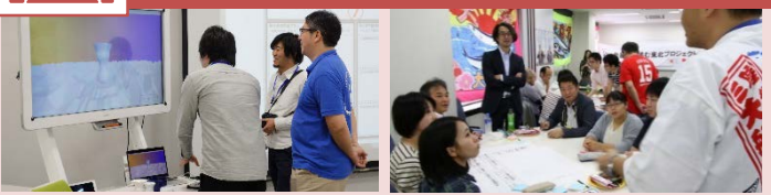
写真：平成29年度共創イベントの様子